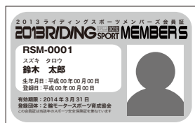
RSM 会員には、このような会員証が送られます。顔写真はこの会員証に使用します

主催者からRSM事務局へ申込書が届き次第、保険の加入作業を行います。加入が済みましたら、メンバーズカードを発行します。カードには、メンバーの名前、生年月日、会員番号、加入した日にちと、顔写真が入ります。カードは原則、主催者にまとめて送られます。